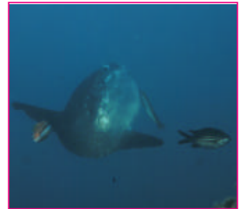
En la piedra podremos encontrar vida pequeña o pelágicos como el pez luna.