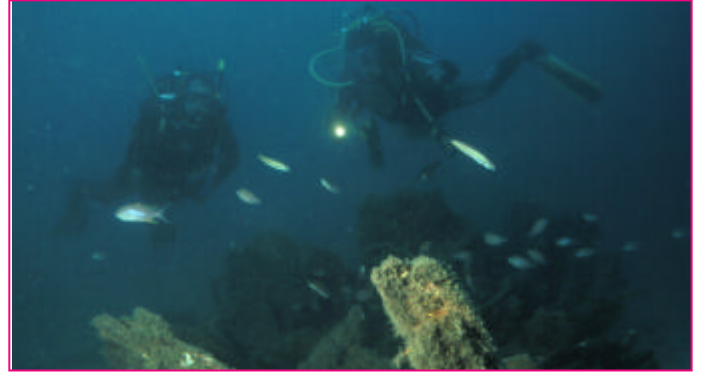
Los restos de una pequeña embarcación y de unos coches son unos de los atractivos de esta inmersión.

Como su propio nombre lo indica, la zona donde se va a realizar la inmersión se encuentra en medio de la bahía que forma el acantilado de Marina del Este con las rocas que cercan al puerto del mismo nombre. Se trata de una gran piedra solitaria cuya base está a unos 26m de profundidad y a partir ella comienza un talud de arena donde podremos alcanzar fácilmente los 40m. La bajada a esta piedra hay que hacerla en caída libre por el azul desde el punto de referencia tomado en la costa o bien comenzar la buceada desde la playa si tomamos coordenadas en brújula, pero debido a la larga distancia a la que se encuentra y el monótono fondo arenoso hasta el punto podría despistarnos y no encontrarla. En ella podremos ver numerosa vida pequeña, los restos de una embarcación y unos coches e incluso peces luna.