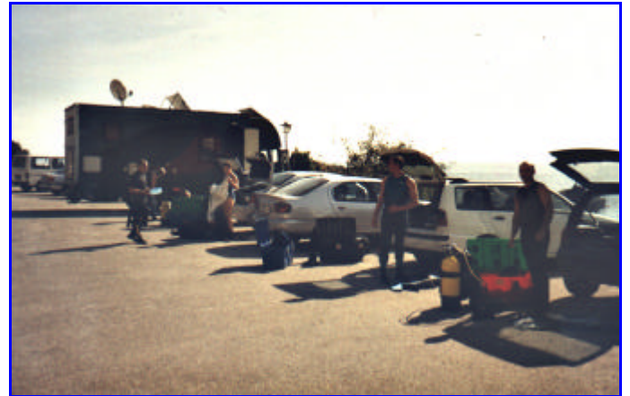
El aparcamiento nos permite montar cómodamente los equipos y prepararnos para la inmersión.