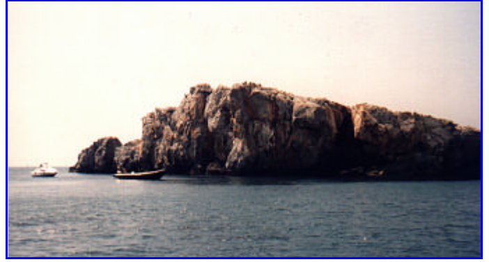
Acantilado de Marina que tomaremos de referencia en esta inmersión.

El punto de inmersión está situado en la punta exterior del acantilado que limita la playa de Marina del Este por poniente. Se trata de una inmersión profunda ya que se llegan a alcanzar los 40m de profundidad aunque se comienza a bajar progresivamente desde los 15m. El punto de bajada está protegido del viento de poniente por la pared del acantilado lo que posibilita el buen fondeo del barco y la preparación del equipo antes de bajar si vamos a nadar. Durante el avance iremos notando el aumento de la corriente al ir acercándonos al mar abierto. A unos 25m aparecerán las primeras ramas de coral (coral amarillo) que irán aumentando poco a poco conforme vallamos cogiendo fondo. Cuando notemos que la pared dobla a la derecha habremos llegado al final de la inmersión por lo cual es importante no perderla de vista.